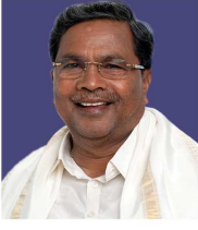
ಸಿದ್ದರಾಮಯ್ಯ ಮುಖ್ಯ ಮಂತ್ರಿಗಳು